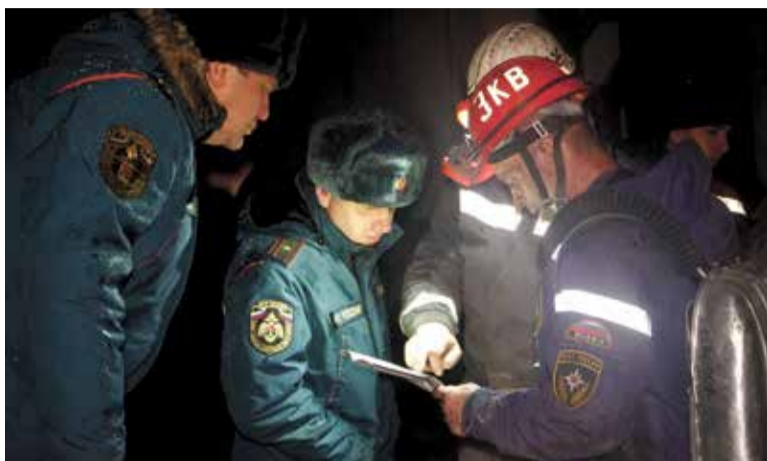
Спасательные работы на шахте начались практически сразу после взрыва

Одновременно разведка выработок проводилась силами 32 отделений ВГСЧ, обследовалось 34 км выработок. В ходе разведки обнаружено трое горнорабочих с признаками жизни. Они эвакуированы на поверхность и переданы медикам. 11 пострадавших обнаружены без признаков жизни, тела троих удалось поднять.