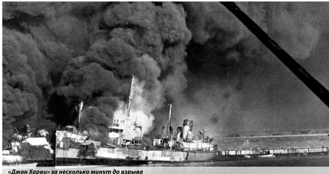
«Джон Харви» за несколько минут до взрыва

Годом ранее, получив от Сталина информацию о подготовке немцами химической войны против Красной армии, Черчилль выступил с публичным предупреждением к Гитлеру, пригрозив ударом боевыми отравляющими веществами (БОВ) по германским городам. Тогда эта угроза сработала, но после высадки в Италии американский президент Рузвельт решил подстраховаться и подготовить средства для возможного ответного удара. Согласно договору о запрещении химического оружия страна, против которой было применено химическое оружие, автоматически получала право на аналогичное и