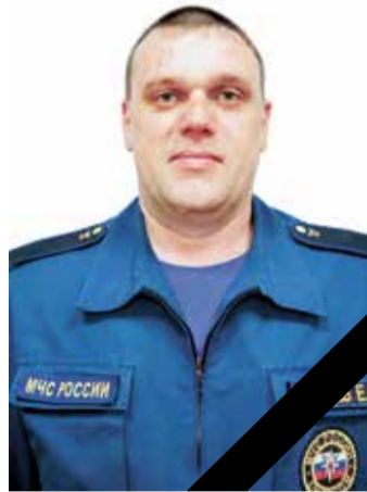
ЗЕМЦЕВ Евгений Викторович

«Это общая беда и боль для Кузбасса и для всей России. Еще раз выражаю глубокие соболезнования, слова поддержки семьям, родным и близким погибших. Желаю скорейшего выздоровления всем пострадавшим.»