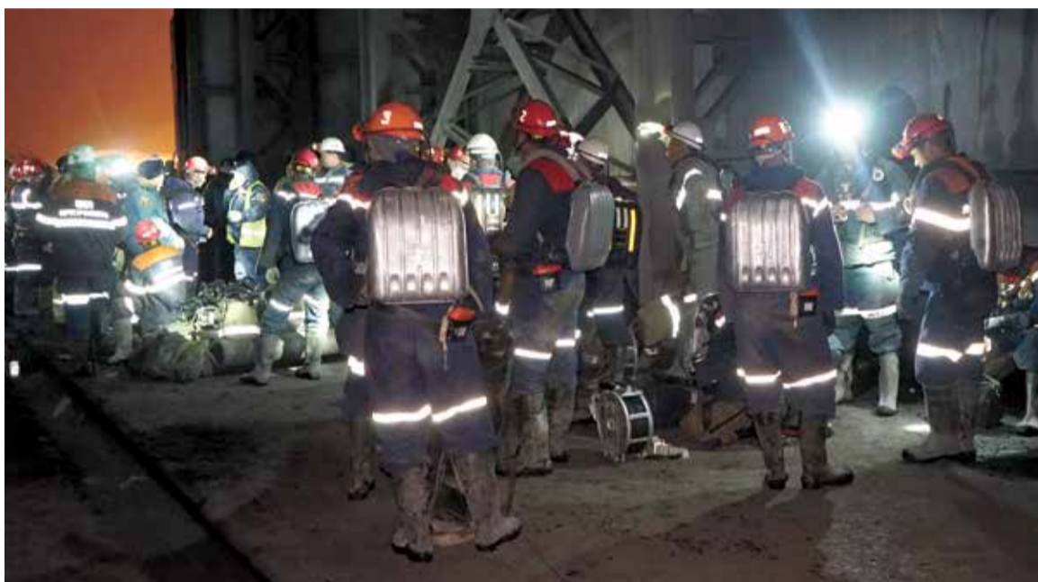
Всего к спасательным работам было привлечено почти триста человек

В связи с ухудшением обстановки в горной выработке на аварийном участке и возможностью возникновения повторных газодинамических явлений в 12.10 ведение аварийно-спасательных работ было приостановлено. Отделению ВГСЧ была дана команда выходить на поверхность.